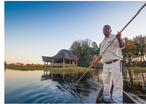
Botswana Delta d'Okavango