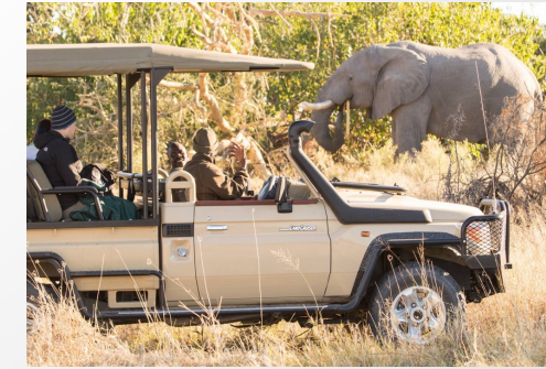
Afrique du Sud Le Big Five