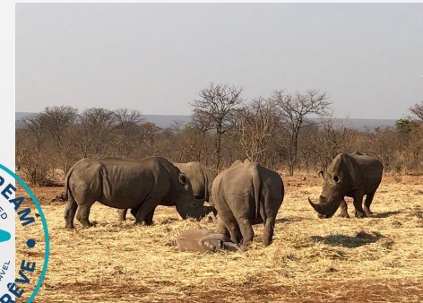
Zambie Expérience rhinocéros