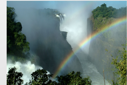
Zimbabwe Incroyables Chutes Victoria